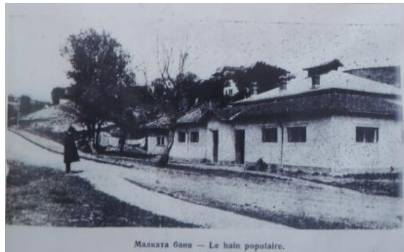
Малката баня — Le bain populaire.